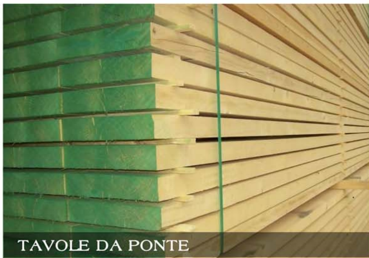
TAVOLE DA PONTE

Disponiamo a magazzino di legname per l'edilizia come assiti grezzi e piallati in abete e larice, tavole e travetti per armatura grezzi e piallati, perlinati di diverse essenze, pannelli gialli, listelli e listoni, tavole da ponte, travi H20, travi usate per ferrovie certificate.