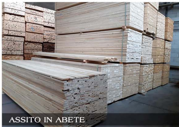
ASSITO IN ABETE