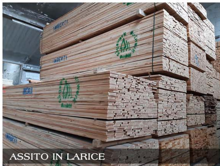
ASSITO IN LARICE