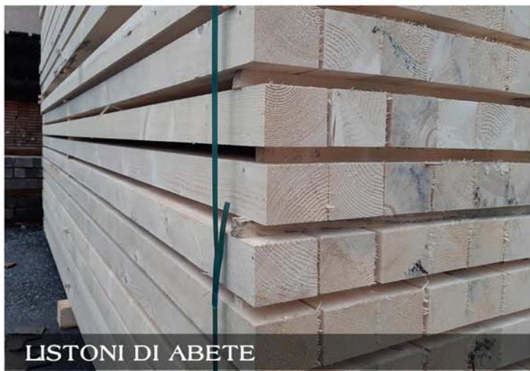
LISTONI DI ABETE

Disponiamo a magazzino di legname per l'edilizia come assiti grezzi e piallati in abete e larice, tavole e travetti per armatura grezzi e piallati, perlinati di diverse essenze, pannelli gialli, listelli e listoni, tavole da ponte, travi H20, travi usate per ferrovie certificate.