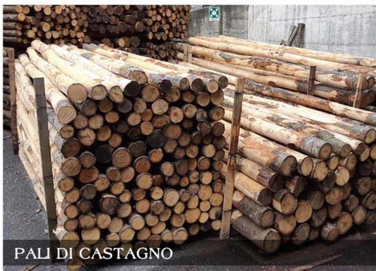
PALI DI CASTAGNO