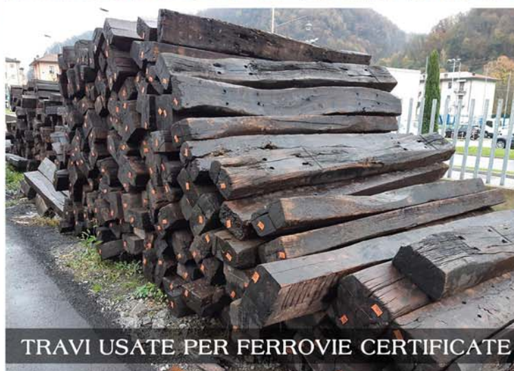
TRAVI USATE PER FERROVIE CERTIFICATE