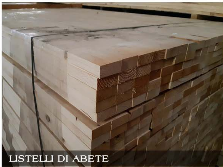
LISTELLI DI ABETE