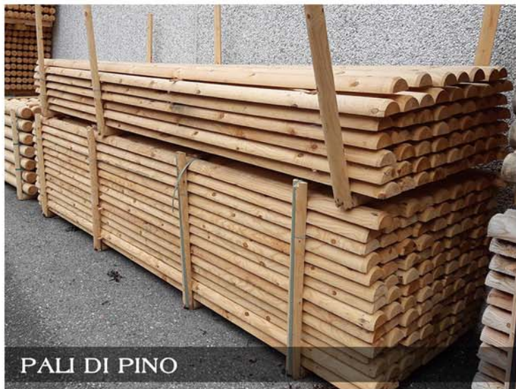
PALI DI PINO