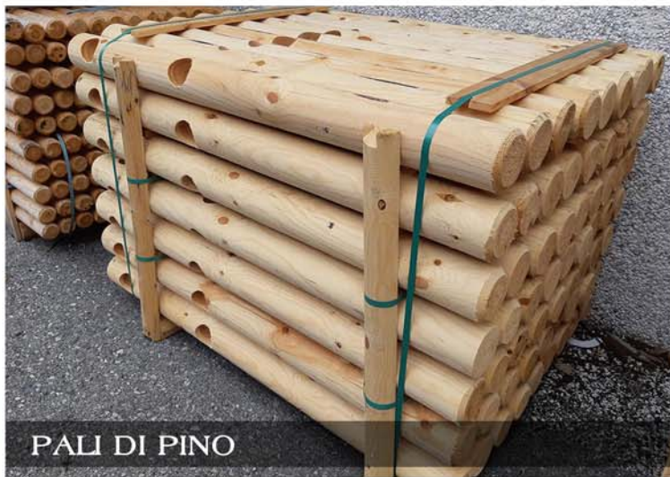
PALI DI PINO