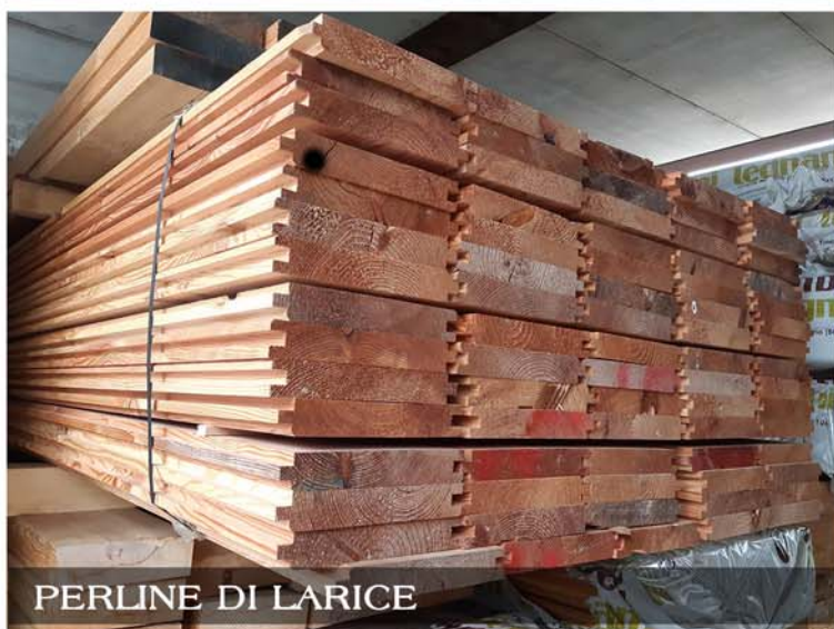
PERLINE DI LARICE