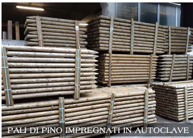
PALI DI PINO IMPREGNATI IN AUTOCLAVE