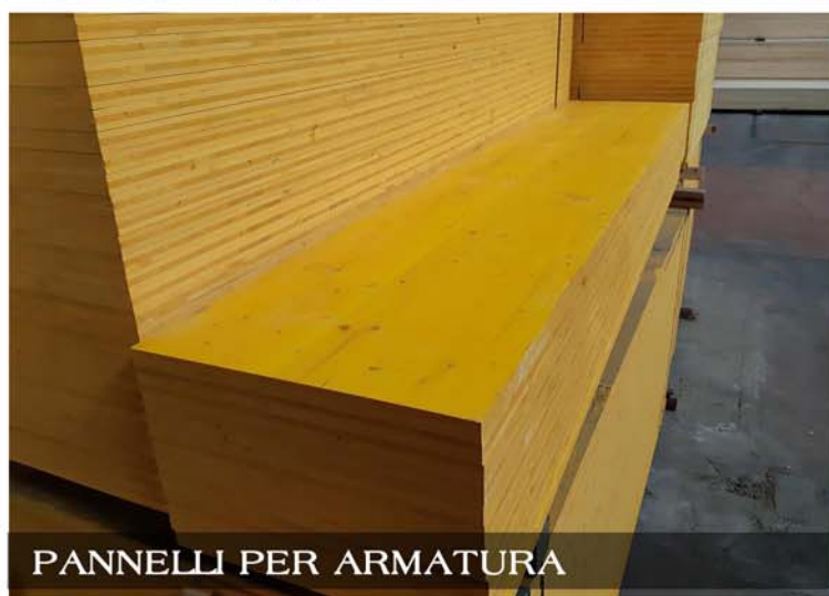
PANNELLI PER ARMATURA