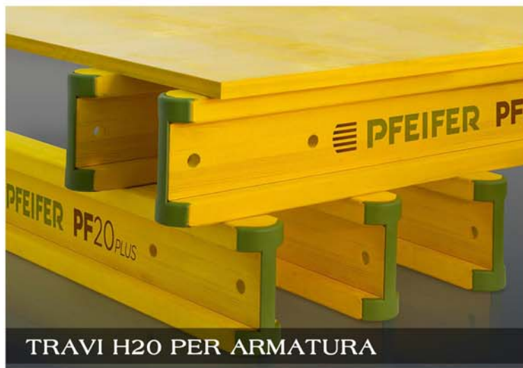
TRAVI H20 PER ARMATURA