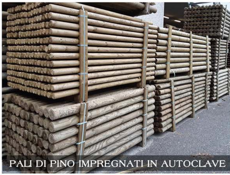
PALI DI PINO IMPREGNATI IN AUTOCLAVE