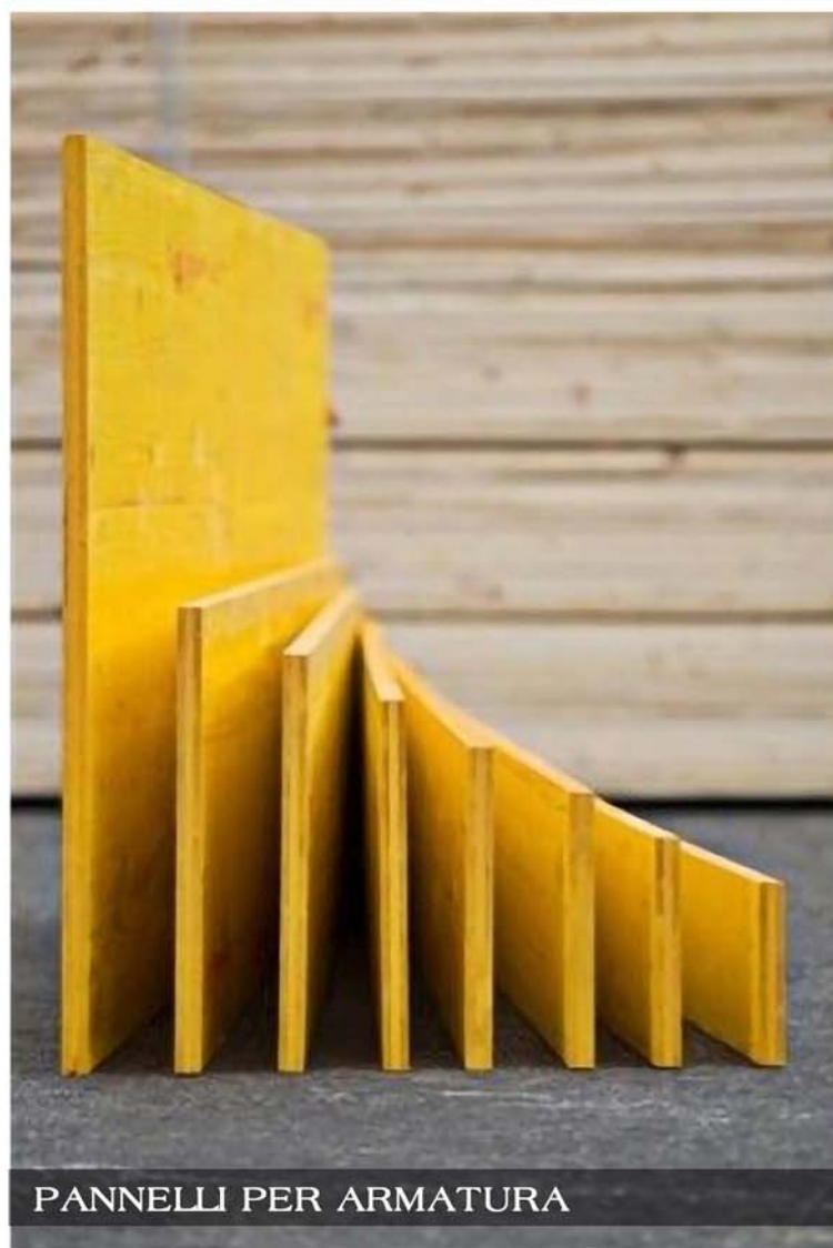
PANNELLI PER ARMATURA