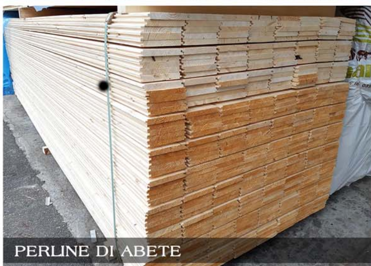
PERLINE DI ABETE